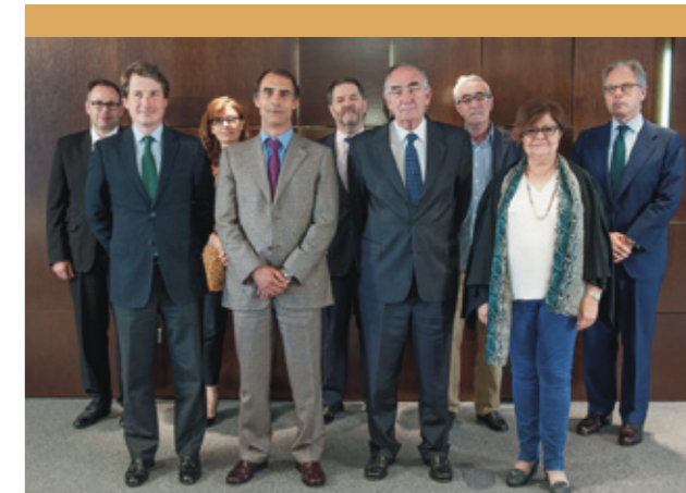
Foto de familia del Jurado de esta V Edición.

El jurado de la V edición de los premios de la Fundación Caser se reunió el 4 de junio a las 14.30 h para emitir su fallo sobre las 310 candidaturas presentadas.